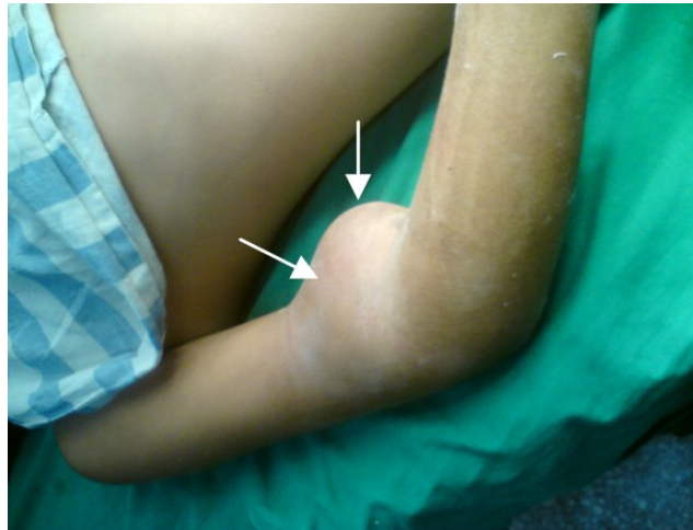
Fig. 1. Imagen macroscópica del pseudoaneurisma