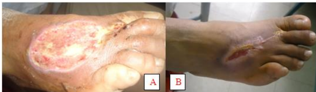
Fig. 2. Paciente con úlcera de pie diabético

B: Granulación y epitelización a las 25 dosis aplicadas de Heberprot-P®