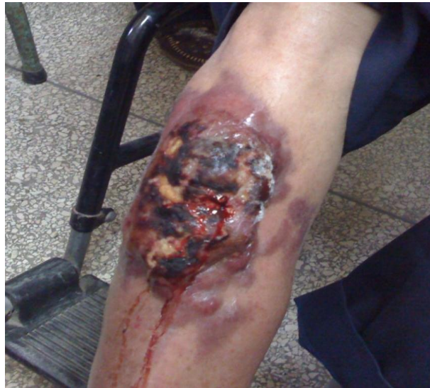
Fig. 1. Carcinoma de células de Merkel . La superficie mamelonada, sangrante, con área necrótica

Extremidades: en cara anterior de Miembro Inferior Derecho (MID), lesión en placa, de bordes bien definidos, de más menos 10 cm, con lesiones nodulares pequeñas que confluyen hacia el centro y tendencia a formar un cráter central de color negruzco con restos necróticos (fig. 1).