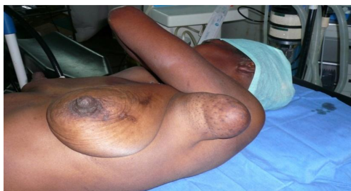
Fig 1. Presencia de mama sin pezón en axila izquierda

Al examen físico se comprueba el aumento de volumen (7 cm), con evidente parecido a una mama, pero con ausencia de pezón (fig. 1).