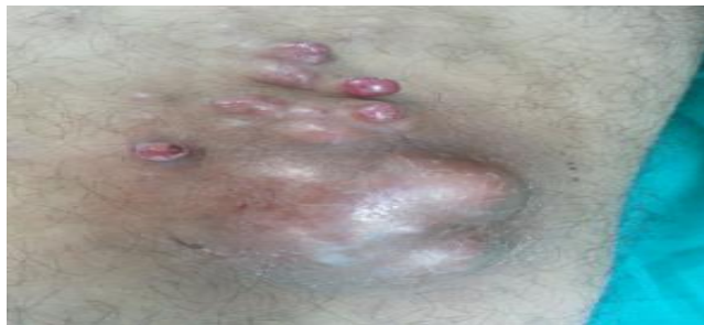
Fig. 1. Lesiones nodulares eritemato violáceas que conforman la lesión tumoral

Examen dermatológico: a nivel del muslo derecho, en su región superior interna, se observan varias lesiones nodulares de tamaño variable, eritemato violáceas, que confluyen y forman una placa elevada de aspecto tumoral, aproximadamente de 10 cm de diámetro, bordes bien definidos e irregulares y consistencia pétrea al tacto (fig. 1).