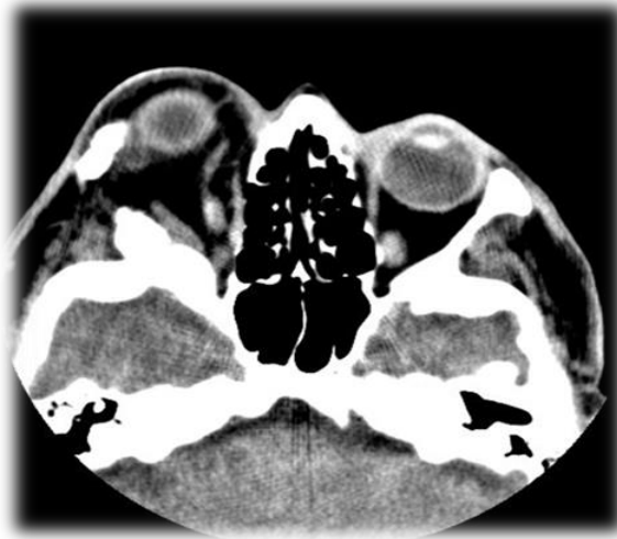
Fig.3. Cortes tomográficos de TAC evidencian exoftalmos derecho

En la tomografía axial computarizada de senos paranasales, con espesor de cortes de 2 mm, se observa un marcado engrosamiento y esclerosis con aspecto de vidrio esmerilado que expande la cortical y deforma la arquitectura ósea normal; que interesa al hueso frontal derecho, maxilar superior, arco cigomático, hueso esenoide y piso de la fosa media, y reduce el diámetro orbitario; que ocasiona exoftalmos ipsilateral y seno frontal, con ausencia de neumatización en celdillas derechas. Se comparan con las estructuras contralaterales, las cuales no muestran alteraciones. Se concluye como una displasia fibrosa monostótica (fig. 4).