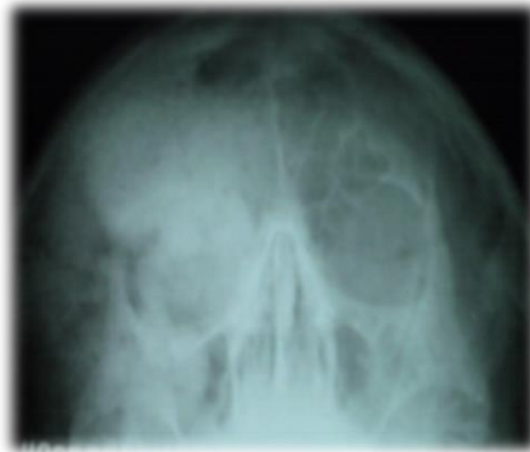
Fig.2. Radiografía de senos paranasales. Vista de Water

Como parte del estudio imagenológico, se realiza una radiografía de senos paranasales (vista de Water ) (fig.2). En dicha radiografía se observa una opacidad con aspecto de vidrio esmerilado que ocupa el hueso frontal y las celdillas del seno frontal derecho, con ausencia de neumatización que, compromete la órbita derecha, el hueso maxilar superior y seno maxilar derecho.