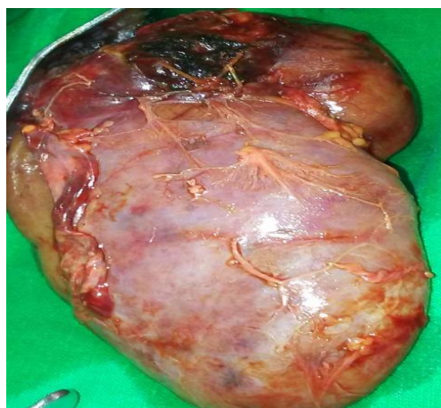
Fig. 2. Pieza quirúrgica con tumoración en polo superior del riñón

Con estos hallazgos, el caso fue discutido en el Servicio de Cirugía Pediátrica de Holguín y decidimos realizar la intervención quirúrgica, pues desde el punto de vista imagenológico se confirma un tumor renal. Se realizaron dos biopsias transoperatorias de la zona tumoral de aspecto necrótico del riñón derecho, las cuales no fueron concluyentes y se realizó nefrectomía total del riñón derecho (por vía transperitoneal). Macroscópicamente, hacia el polo superior se observó zona necrótica, ulcerada, cavernosa y sin contenido purulento (fig. 2 y 3).