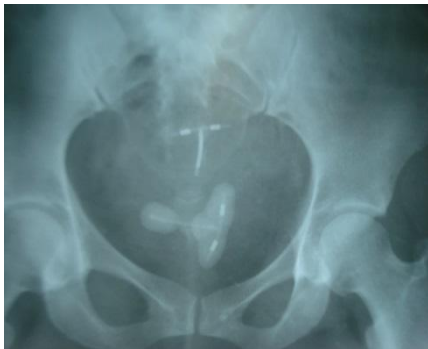
Fig.1. Radiografía de pelvis ósea que evidencia dos cuerpos extraños, DIU tipo T

En orina, hematíes y leucocitos abundantes más Escherichia coli , por lo que se decide ingreso y tratamiento, según sensibilidad con amikacina 2 bulbos de 500 mg en dosis única diaria, que se comprueba mediante urocultivo posterior negativo. En ingreso, es indicada ecografía que señala refringencia a nivel vesical sugestiva de litiasis. La radiografía de pelvis ósea (fig.1) evidencia dos cuerpos extraños radiopacos en la excavación pélvica, que sugieren corresponder ambos con DIU, uno de ellos con contorno radiopaco. La observación por cistoscopia constata litiasis vesical con forma atípica (fig.2).