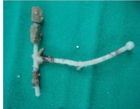
Fig. 3b: núcleo litiásico extraído de la cavidad vesical constituido por dispositivo anticonceptivo intrauterino tipo T

La evolución de la paciente fue favorable, con egreso a las 18 horas, luego de la cirugía, y logró su reincorporación social y laboral a los 10 días siguientes.