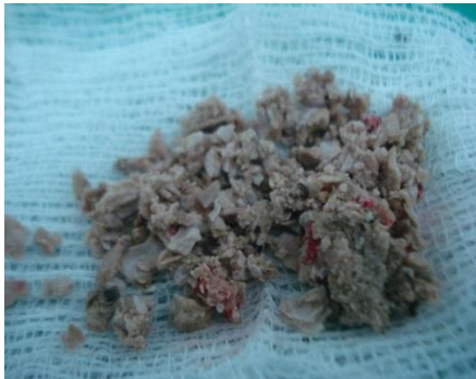
Fig. 3a: cubierta calculosa fragmentada.

Con esta idea diagnóstica se propone y realiza tratamiento quirúrgico endourológico, cistolitolapaxia, que logra fragmentar mecánicamente la cubierta calculosa (fig.3a) y extraer de su interior un DIU tipo T (fig.3b)