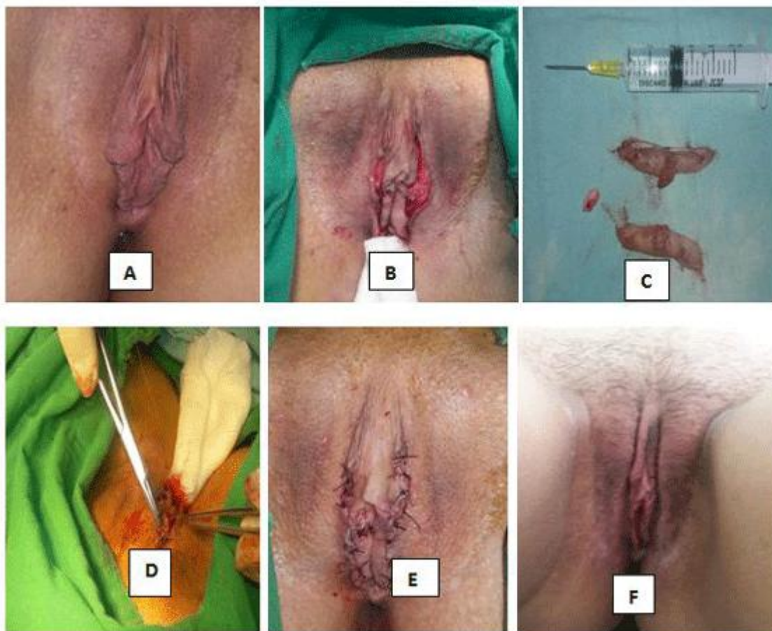
Fig. 1. A Redundancia del labio menor B C D Transoperatorio. Exéresis del tejido redundante del labio. Plastia y sutura de los labios menores.

De forma general, las pacientes se mostraron y refirieron estar muy satisfechas con la cirugía, después de la cual se obtuvo gran satisfacción en cuanto a los resultados y expectativas lo que se revirtió favorablemente en ámbitos estéticos, funcionales y psicológicos, resultado que se corresponde con el de otros autores como Jack Pardo y cols , 9 así como Sharp y cols 11 que en un estudio prospectivo, mostraron que la labioplastia bien indicada proporciona excelentes resultados, con alto grado de mejoría en la autoestima y disminución del discomfort local. A consideración de las autoras la casuística pudiera ser mayor si se le diera mayor divulgación a esta opción que por pudor y desconocimiento no es solicitada tan frecuentemente como otros tipos de cirugías estéticas, considerando la existencia de un sub registro en las estadísticas del contexto en estudio.