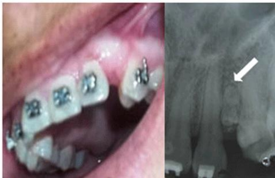
Fig. 1 Imagen preoperatoria y Rx periapical previo al tratamiento quirúrgico.

Se presentó a la consulta de la Clínica Estomatológica Docente 26 de Julio en Banes, Holguín, una paciente femenina de 39 años de edad, sin antecedentes generales de interés, por presentar pérdida espontánea de un diente temporal; el cual, según refirió, ocupaba el espacio correspondiente a un diente permanente que quedó retenido y fue extirpado quirúrgicamente años atrás. La paciente se mostró preocupada por su afectación estética. A través del examen físico intrabucal, se corroboró la ausencia clínica del diente número 13 y, en su lugar, la presencia de una mucosa que evidenciaba la exfoliación reciente de un diente, con una notable disminución del espacio entre el incisivo lateral y la primera bicúspide superior izquierda. Se apreció además, la discrepancia hueso-diente-negativa moderada, en la arcada superior ( fig. 1 ).