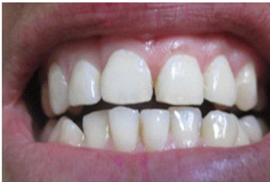
Fig. 3 Resultado estético y funcional postratamiento ortodóntico

La paciente mostró una buena evolución postquirúrgica. Luego de la total recuperación del área intervenida, se comenzaron los movimientos ortodónticos que, finalmente, permitieron obtener un resultado estético y funcional óptimo ( fig. 3 ).