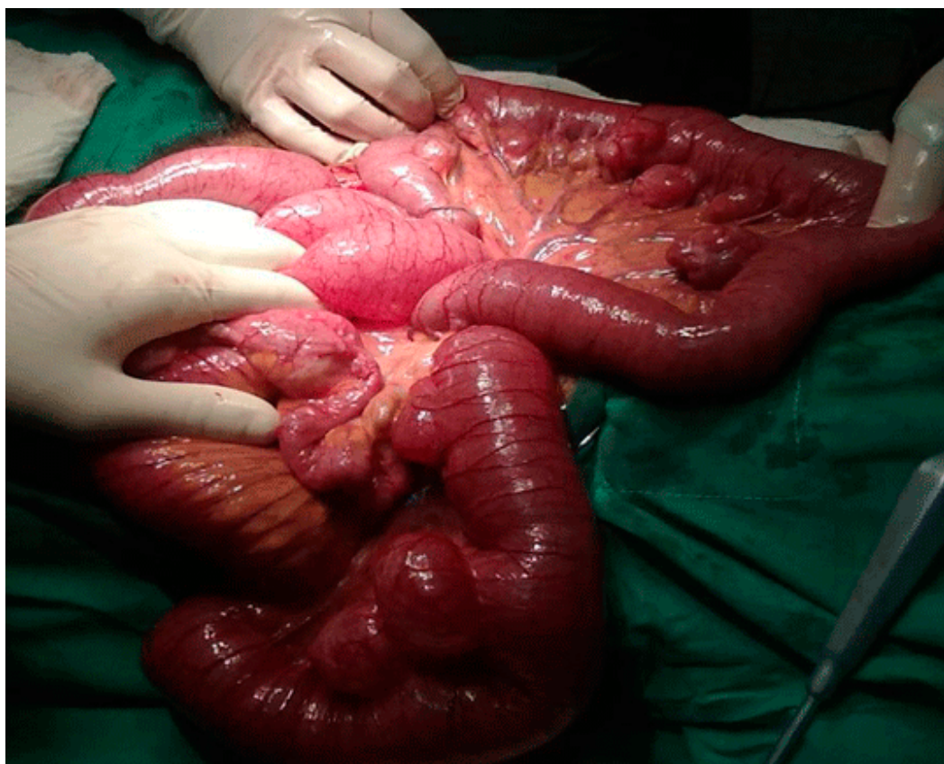
Fig. 1. Laparotomía exploradora con múltiples divertículos en intestino delgado

Se dejó un drenaje tubular en espacio parietocólico derecho y otro en fondo de saco de Douglas. Se solicitó lavado peritoneal a demanda.