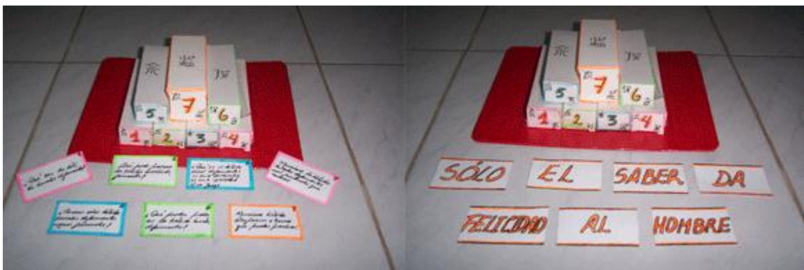
Fig. 2. La caja china

Tema 2: Sabe más quien pesca más ( fig. 3 ).