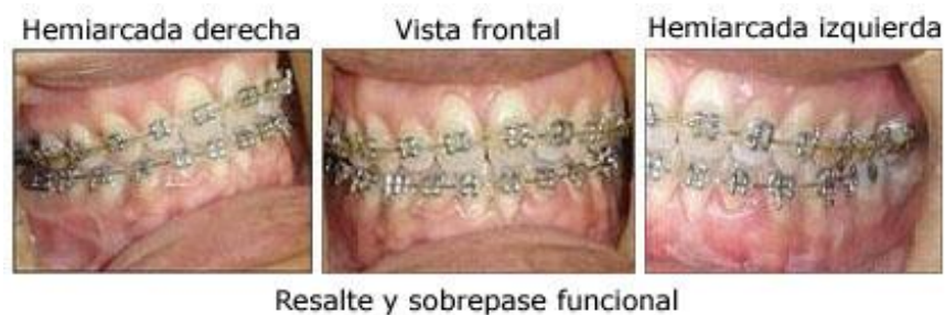
Fig. 5. Fotografías intraorales postquirúrgicas

Se realizó cirugía de retroposición mandibular con una técnica de tipo extraoral: osteotomía vertical en rama Cadwell Letterman y mentonoplastia de reducción de altura. Se colocó la férula quirúrgica y se realizó fijación elástica con ligas intermaxilares. Luego, a los 21 días de darse el alta quirúrgica, se le retiró la férula y al cabo de ocho semanas se procedió al tratamiento ortodóncico mediante la colocación de arcos de trabajo de acero inoxidable 016' para finalización y detalles. Al cabo de los seis meses, cumplidos los objetivos del tratamiento (fig.5), se pasó a la fase de contención.