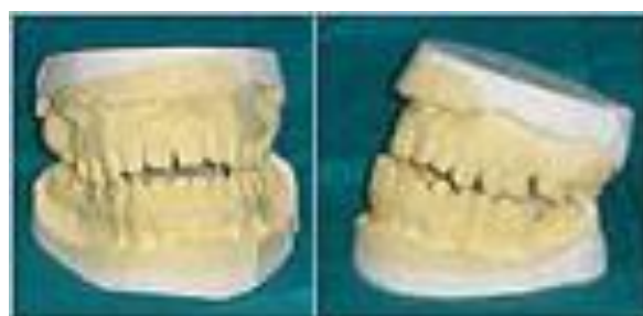
Fig.1. Modelos de estudio

La relación oclusal de las arcadas dentarias mostró mordida cruzada anterior con resalte de -5 mm, relación canina de mesioclusión, línea media inferior desviada a la izquierda 3 mm, mordida cruzada posterior de 23/34, borde a borde de 24,25/ 34, 35,36; mordida abierta anterior de 13 a 23 de 5 mm (fig.1).