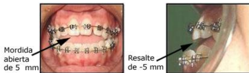
Fig. 3. Fotografías intraorales prequirúrgicas

A los seis meses de iniciado el tratamiento, se colocó aparatología fija superior: Brackets preajustados prescripción Roth, secuencia de arcos de acero inoxidable: 014" ,016", 022" x 016" hasta el arco final rectangular 019" x 025" (fig.3).