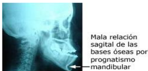
Fig. 2. Teleradiografía lateral de cráneo