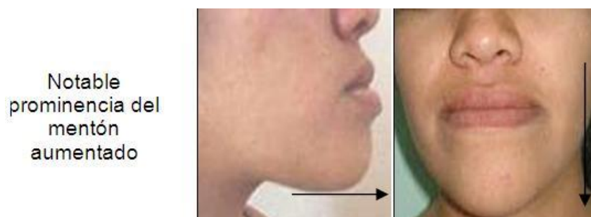
Fig. 6. Fotografías iniciales: de frente y medio perfil

Se alcanzó disminución significativa de los tejidos duros del tercio inferior, reducción de la altura facial inferior, longitud mandibular (fig. 6) y profundidad facial (fig. 7).